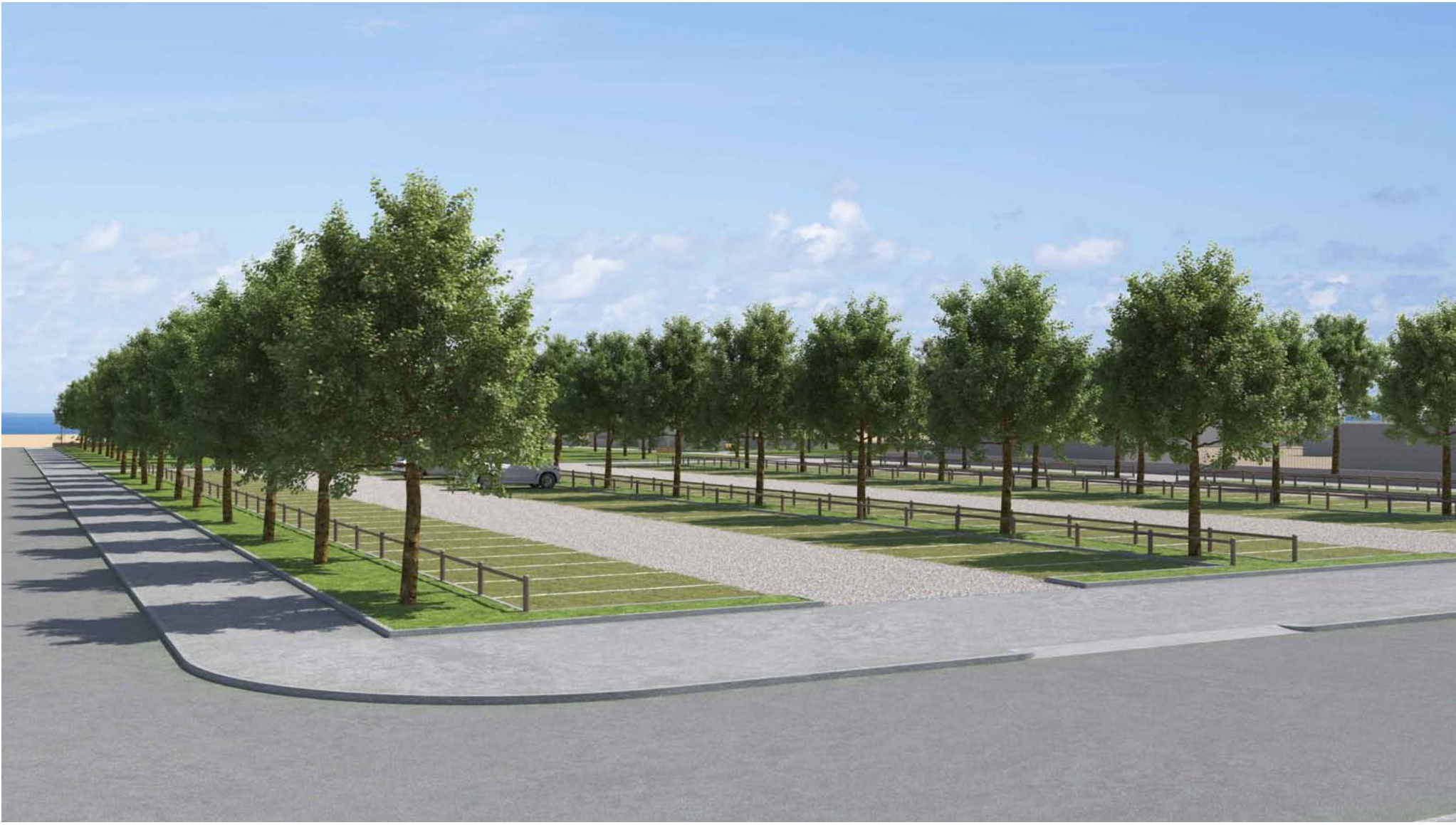
VISTA LATO OVEST