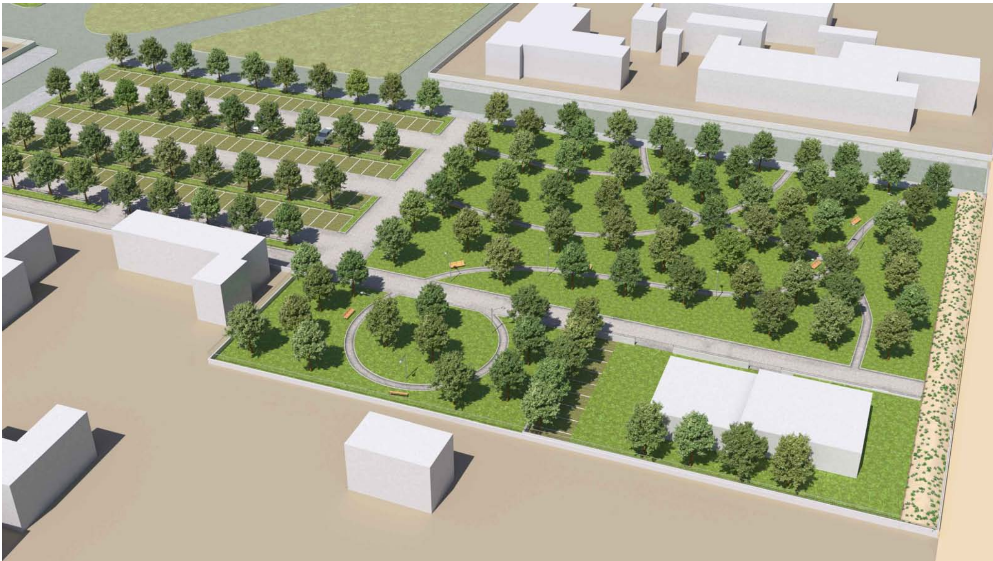
VISTA AEREA LATO EST