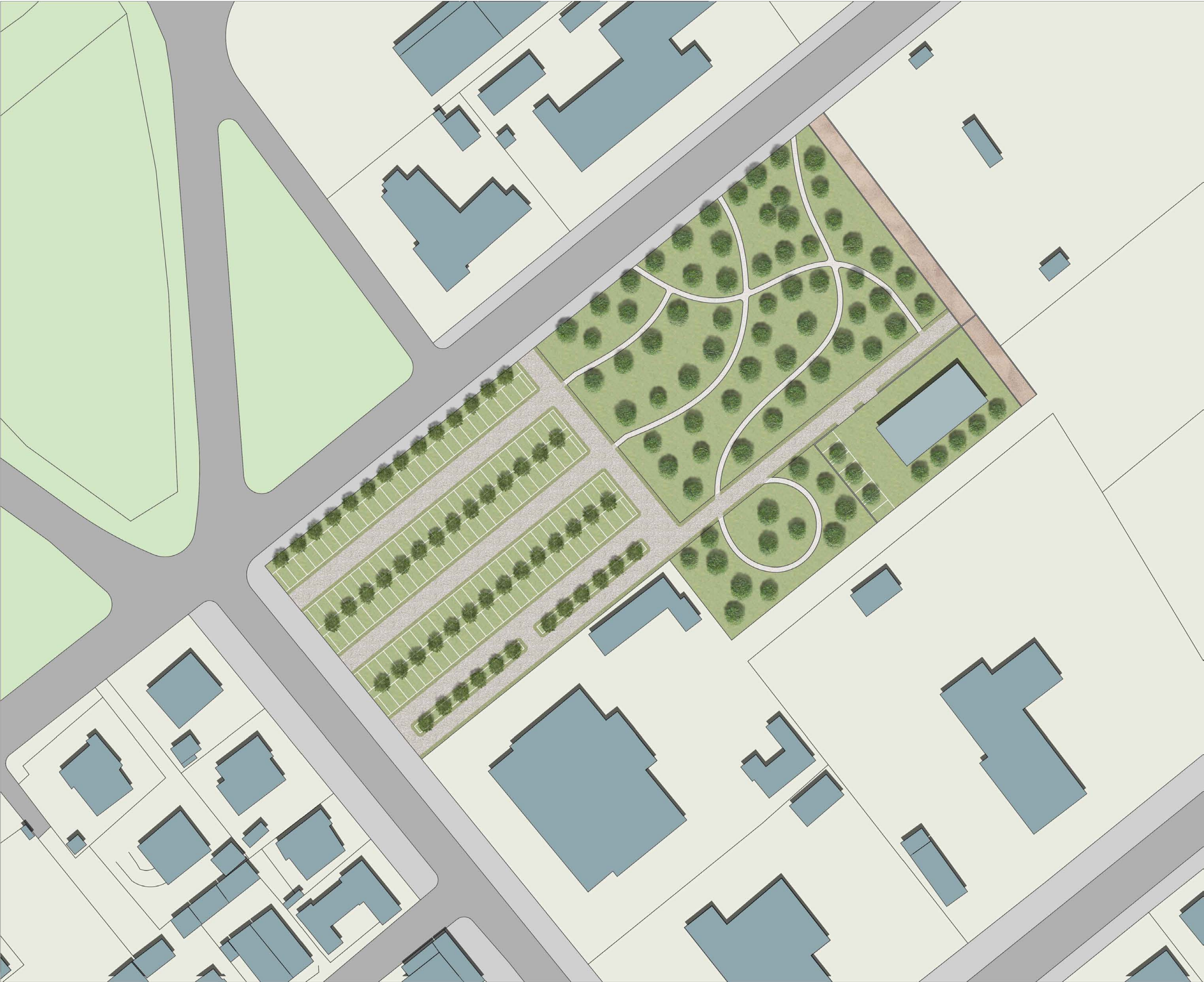
PROGETTO DI FATTIBILITÀ SISTEMAZIONE AREE PUBBLICHE