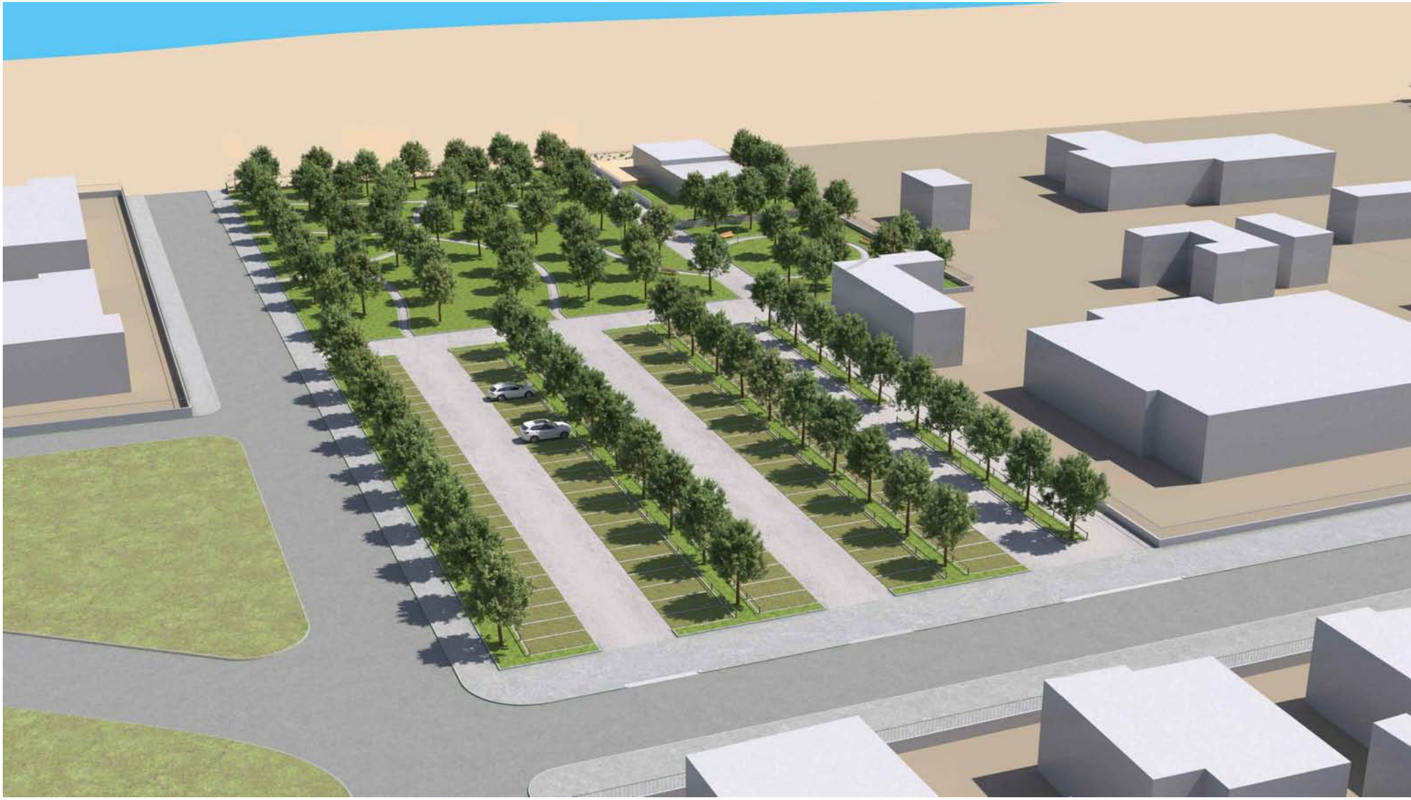
VISTA AEREA LATO OVEST